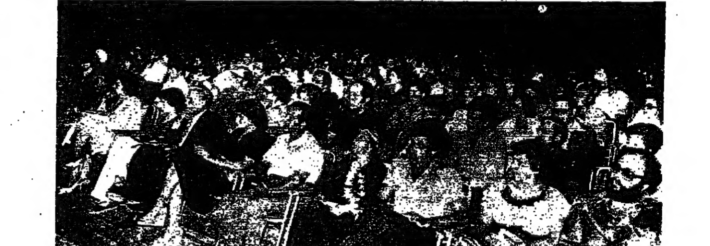
جمهورية حاكم ، سلبت ، في وجهه حنون ..